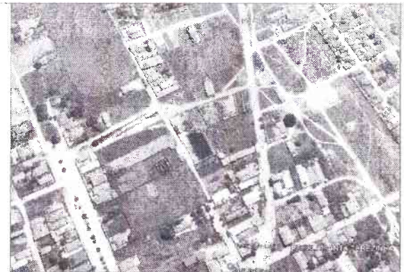
PLANTA DE SITUAÇÃO

GOVERNO MUNICIPAL MOREILÂNDIA CONSTRUINDO UMA NOVA HISTÓRIA PREFEITURA MUNICIPAL DE MOREILÂNDIA